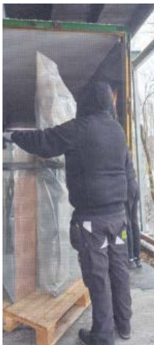
Møblerne er forseglet og køres til frysning

Tegn på et omfattende angreb af bobiller. Da møblerne blev afleveret til museets magasin i Tåstrup, måtte de derfor forsegles i byggeplast. Siden er de blevet sendt til frysning i Museum Vestsjællands store frysecontainer for at få stoppet skadedyrsangrebet. Nu er møblerne bevaret for eftertiden til vidnesbyrd om mennesket bag Danmarks store statsminister, Thorvald Stauning