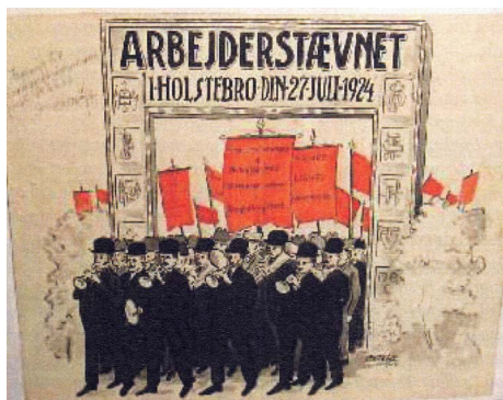
Plakat tegnet af O.V.Høft