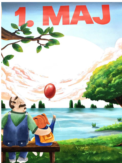
1. Maj plakat 2024