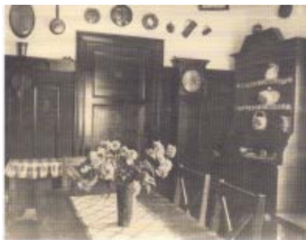
udateret billede af Staunings stue i sommerhuset

Thorvald Stauning havde fra 1917 og til sin død i 1942 sommerhus i Strøby Egede syd for Køge. Huset har senere bl.a. tilhørt tidligere statsminister H.C.Hansen og er nu ejet af dennes barnebarn. I forbindelse med at huset skal moderniseres har Arbejdermuseet fået mulighed for at modtage en del af møblementet bl.a. en slagbænk, en skænk, et bornholmerur og meget mere f.eks. forskelligt kobbertøj. Møblerne bliver nu opbevaret på museets magasin, efter at de har været sendt til frysning, da en del af møblementet var angrebet af borebiller. Vi kan så håbe på at der senere bliver en mulighed for at de kan indgå i en udstilling på museet.