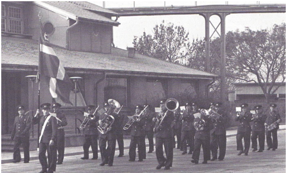
Cementfabrikkens orkester fra 1940'erne

til de arbejdsløse og fagforeningen uddelte også naturalier i form af kul, brød og mælk.