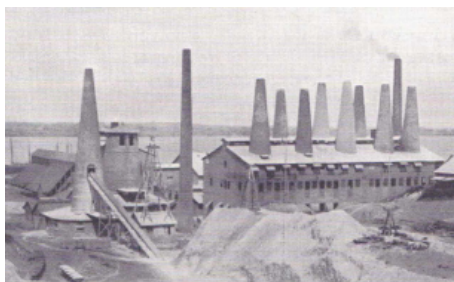
Ålborg Portland ca. 1890