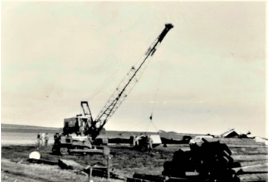
En af de små gravemaskiner