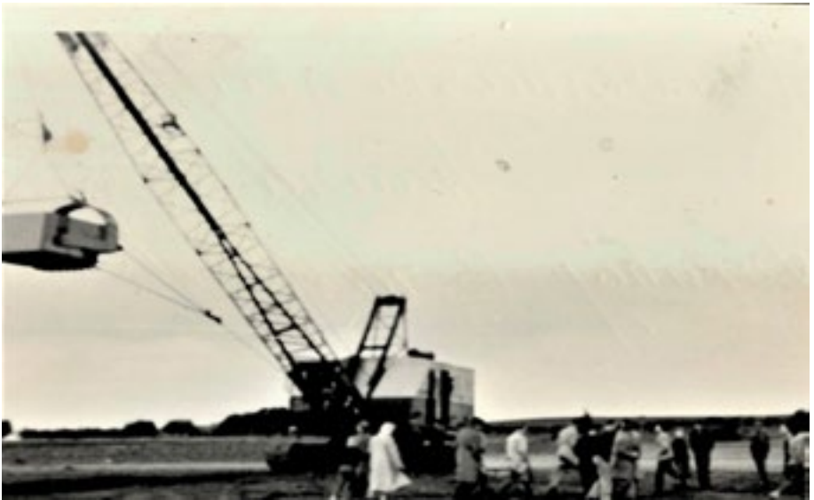
Den store gravemaskine vejede 92 tons