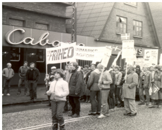
En moddemonstration møder op!