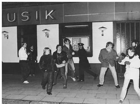
Politiet jager demonstranter væk