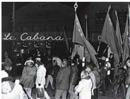
Demonstration foran La Cabana

”Det er et stykke danmarkshistorie, som forskere og andre interesserede nu endelig kan få adgang til og som sætter fokus på et interessant emne. Kampen for selv at kunne vælge fagforening har jo været medvirkende til oprettelsen af de såkaldte gule fagforeninger, som i dag har så meget medvind.”