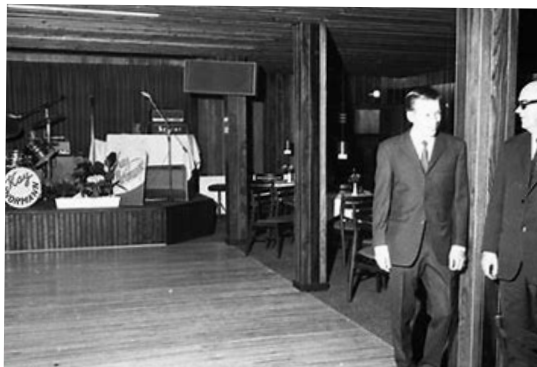
Interiør fra dansegulvet på La Cabana