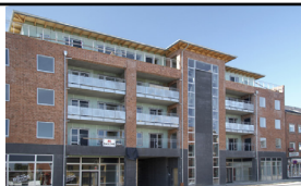
Det nye hus der blev bygget på La Cabana grunden på Silkeborgvej