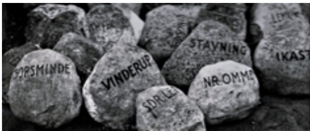
Sten afleveret af kommunerne med indhugget navn

Arkivet ligger inde med en fuldstændig beretning om hvem der tog initiativet, om hvem der har ydet tilskud, og om afsløringen den 28. juli 1946. udført af O.V.Høft.