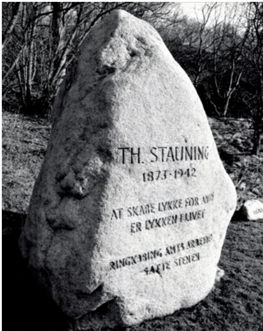
Stauningstenen i Lemvig - rejst til minde om Thorvald Stauning