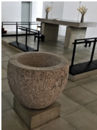
Døbefonten i Gullestrup Kirke