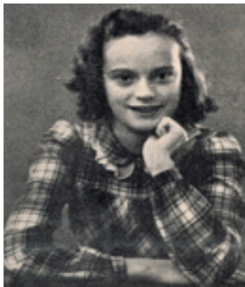
Stauning skrev "de vise ord" i Ingas poesibog

Og nederst: Ringkøbing amts arbejdere satte stenen.