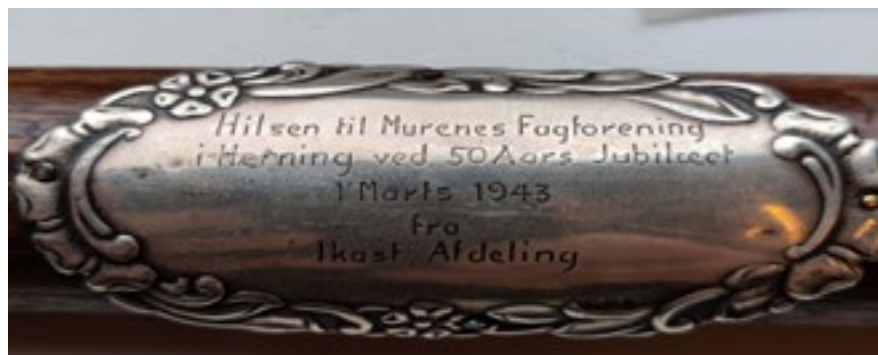
Faneplade som gave fra Ikast afdeling 1943.