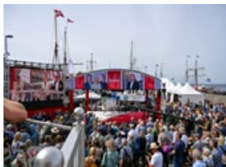
Direkte TV fra Folkemødet