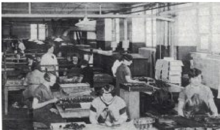
Anton Bergs chokoladefabrik 1919 med det ny transportbånd

I gamle dage var der jo en lang arbejdsdag, men nu med de 8 timer vi har, bliver der mere tid til livet både hjemme og ude,