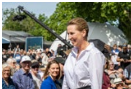
Statsminister Mette Frederiksen hygger sig

De to spor krydsede hinanden, da Bornholms Regionskommune ansøgte Indenrigs- og Sundhedsministeriet om støtte til afholdelse af en demokratifestival på Bornholm. Det blev begyndelsen til et formelt samarbejde, og da Folketingets partier også bakkede op om idéen, gik arbejdet med at arrangere den første udgave af Danmarks demokratifestival på Bornholm i gang.