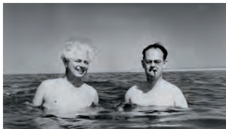
Julius Bomholt og Viggo Kampmann i vandet på Fanø. Bomholdt sad i Kampmanns regering