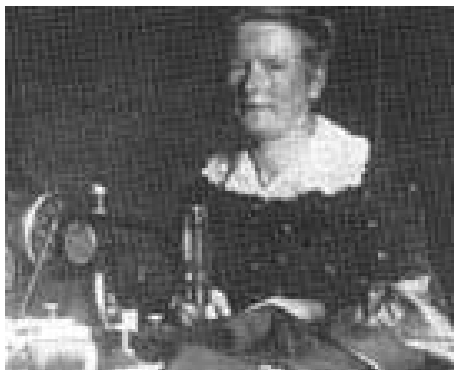
En hjemmesyrske i arbejde

Alle disse Mennesker bliver haardt ramt, hvis der ikke tages særlig Hensyn til dem ved den bebudede Forhøjelse af Gaspriserne”.