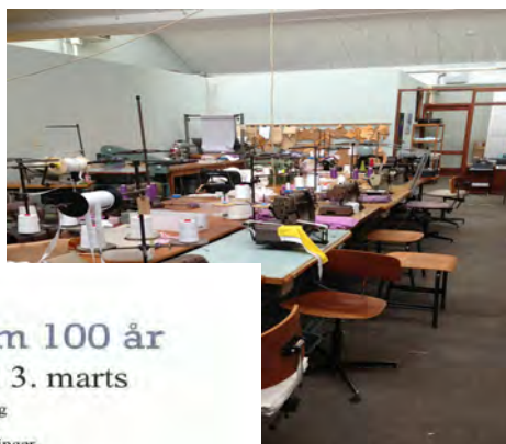
Interior fra en systue, som var i gang under udstillingen