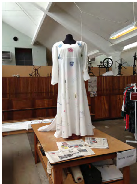
"Herning kjolen" som besøgende syersker skrev deres navn på, og som overdrages Herning by som jubilæumsgave.