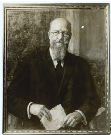
Thorvald Stauning arkiv foto

Under arbejdet i arkivet dukkede, i arkivæsken fra Tekstilarbejderforbundets afdeling i Brande, et gammelt gulnet stykke papir frem.