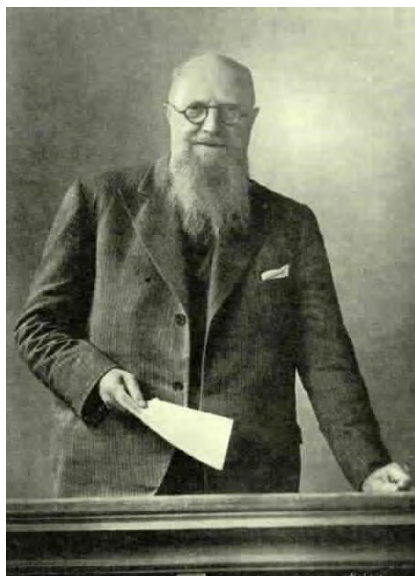
Statsminister Th. Stauning arkiv foto

Ja til Den nye Grundlov. Med venlig hilsen Th. Stauning. ”