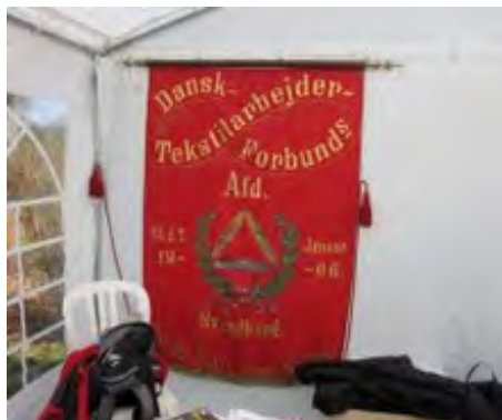
Fra 1.maj i Laugesens Have