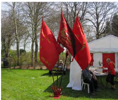
Fanerne bliver luftet