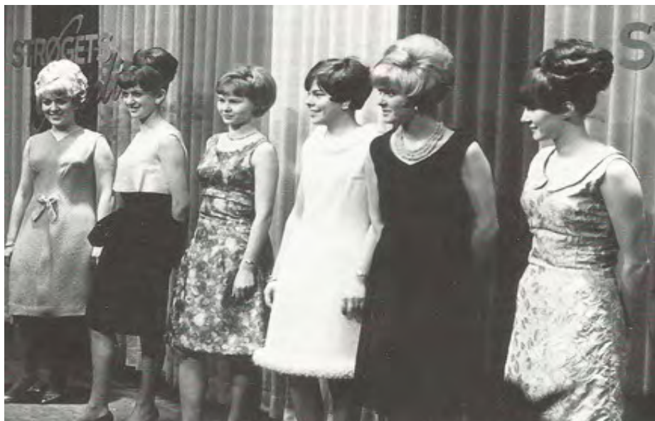
Dengang forventningfulde piger, i dag bedstemødre

at høre musikken og shake med de kønne piger, se venligst billedet. Fulderikker blev simpelthen afvist ved døren.