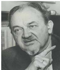
Anker holder tale.

Der var lavet aftale om, at han skulle fragte Anker til Venø, hvor han skulle holde én af de politiske taler – for de voksne !!