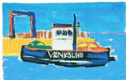
Venøfærgeren malet af Bjørn Søndergaard

Børnene trak vognen ud og stimlede sammen om bilen og var lige ved at trække Anker ud. Han så lige til at begynde med lidt forskrækket ud, men fik så øje på det store banner, de store havde lavet i dagens løb, og sagde så: ”Vent lige lidt, jeg skal have mine sko på.”