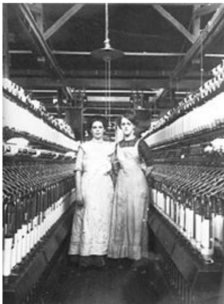
Kvindelige tekstilarbejdere fra 1915