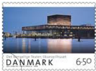
Portoen stiger betydeligt

Samtidig kan vi konstatere at sammenlægningerne af faglige og politiske foreninger endnu ikke er afsluttet, og det bevirker at vi hvert år mister medlemmer alene af den grund.