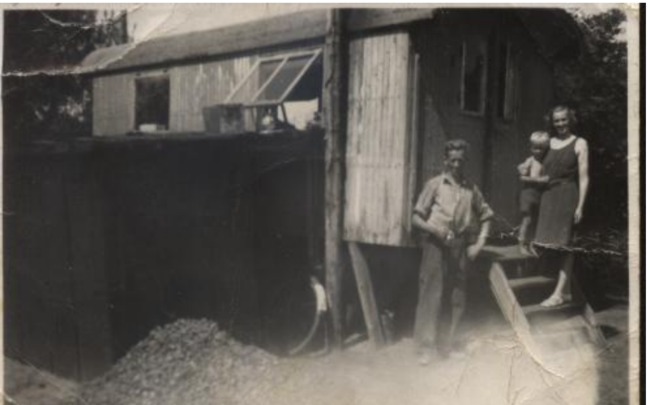
”Nu er det nat i sigøjnervognen” sagde far, når vi skulle sove