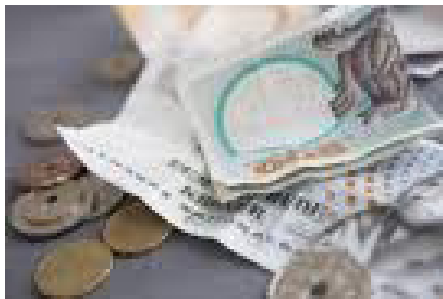
Dit kontingent er vigtigt for os