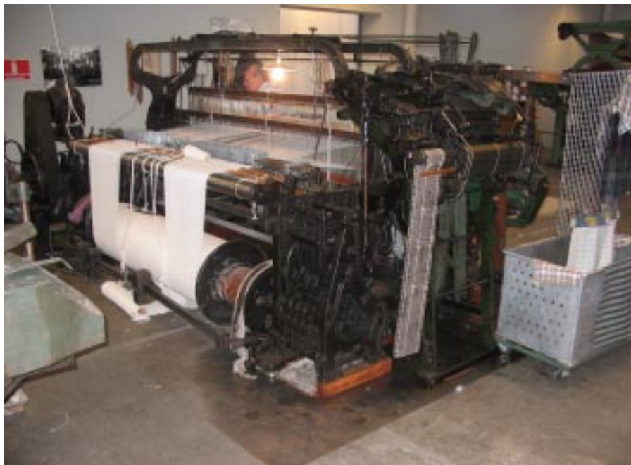
Væv fra Textilforum - Vestergade i Herning

Asra ønsker alle medlemmer R i g t i g g o d j u l o g g o d t n y t å r